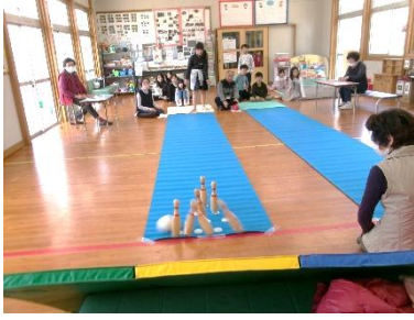
3/2(土) ふれあいボウリング大会