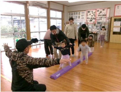
2/16(日) パパとあそぼう (かみむらスポーツ)