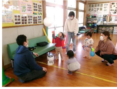
3/7(金) うんどうあそび