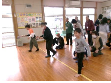
3/8(土) 卒業・進級おめでとう会