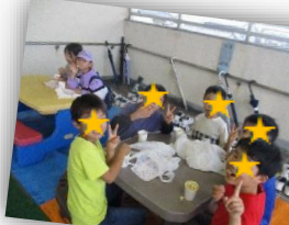
ポップコーンコーナー

児童館・児童センターのホームページはこちらのQRからご確認いただけます! また、児童館のInstagramもあるので、ぜひご覧になって下さい!