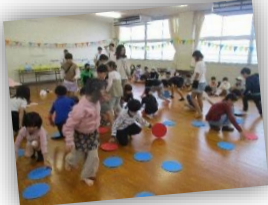
ひっくりかえしゲーム