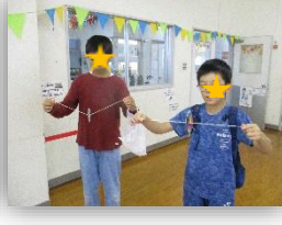
びしびしゴマ工作