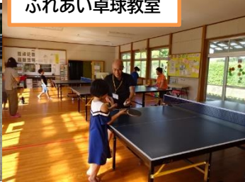
ふれあい卓球教室