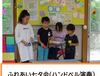
ふれあい七夕会(ハンドバル演奏)