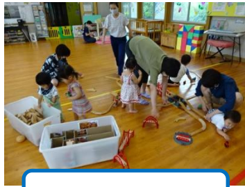
トーマスであそぼう