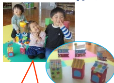
屋根よいたーかい こいのぼり～♪