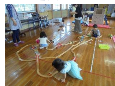
トーマスとあそぼう