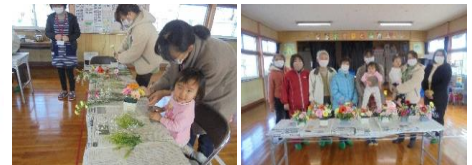
2/18フラワーアレンジメント(生き活き地域子育て応援事業)