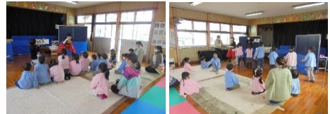
3/4 倉岡幼稚園招待会(パントマイムショー)