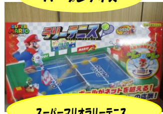
スーパーマリオラリーテニス