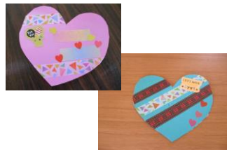
1/21、28 バレンタインカード作り