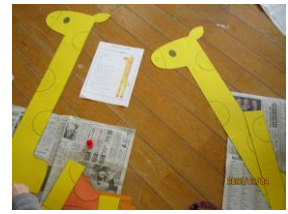
2/4 キリンの身長計作り