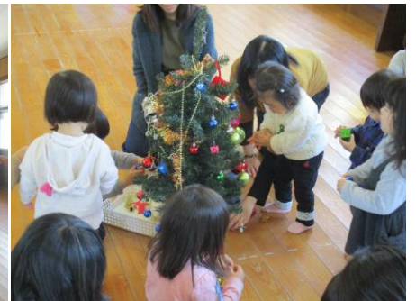
12/4 クリスマスツリーのかざりつけ